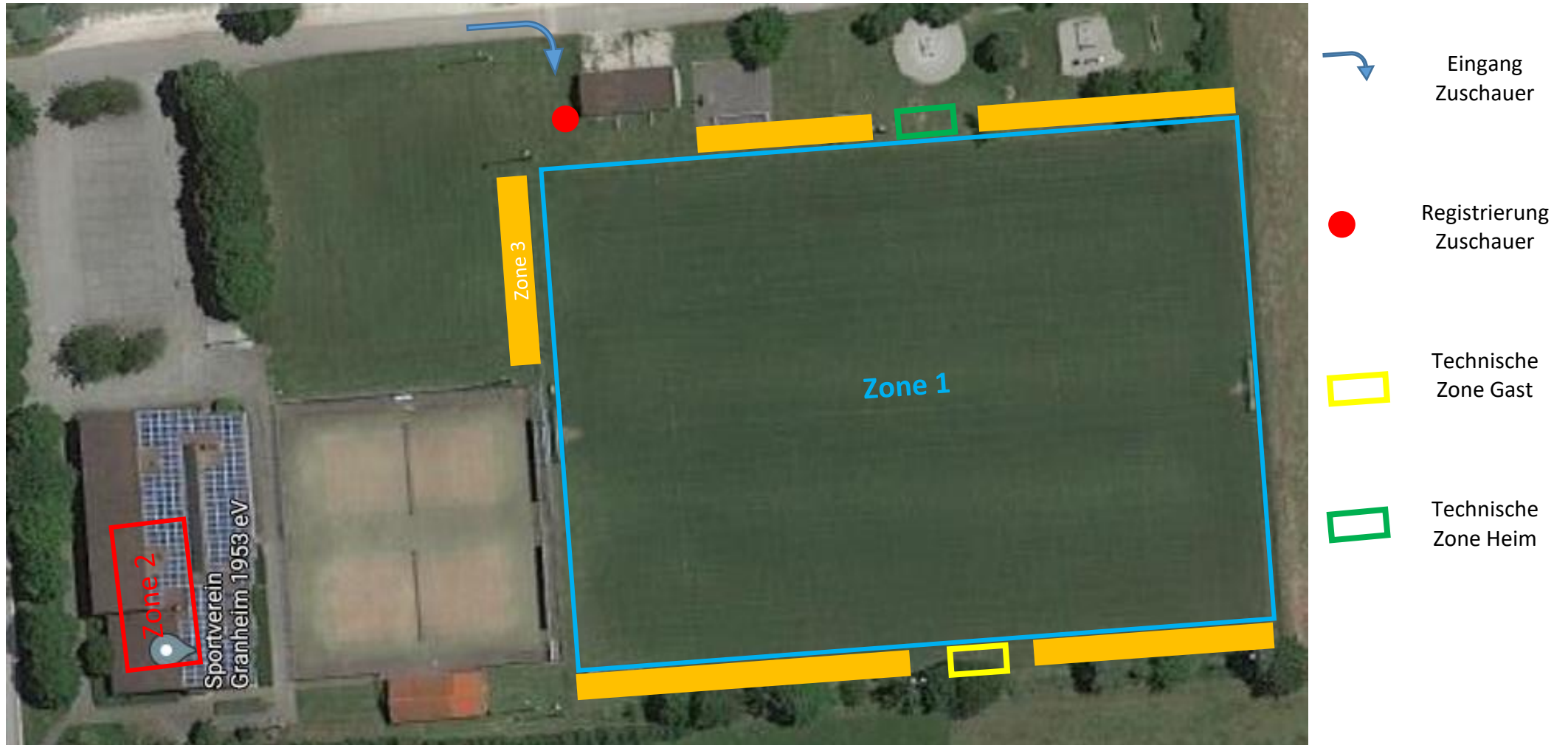
Abbildung 2: Lageplan Spielfeld 2